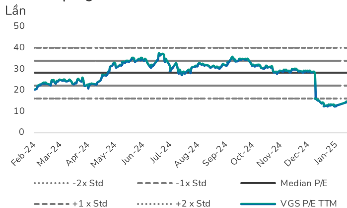
Hình 3: Định giá P/E