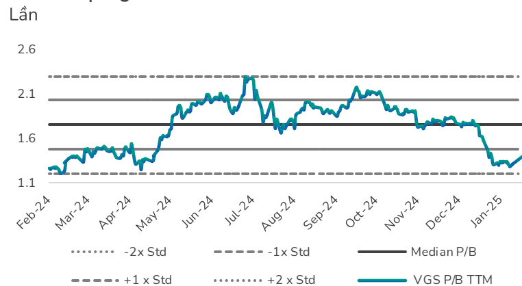
Hình 4: Định giá P/B