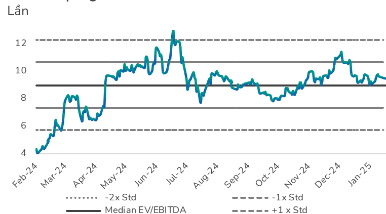
Hình 2: Định giá EV/EBITDA